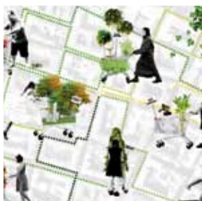
© Cecilia Caldini e Serena Savelli